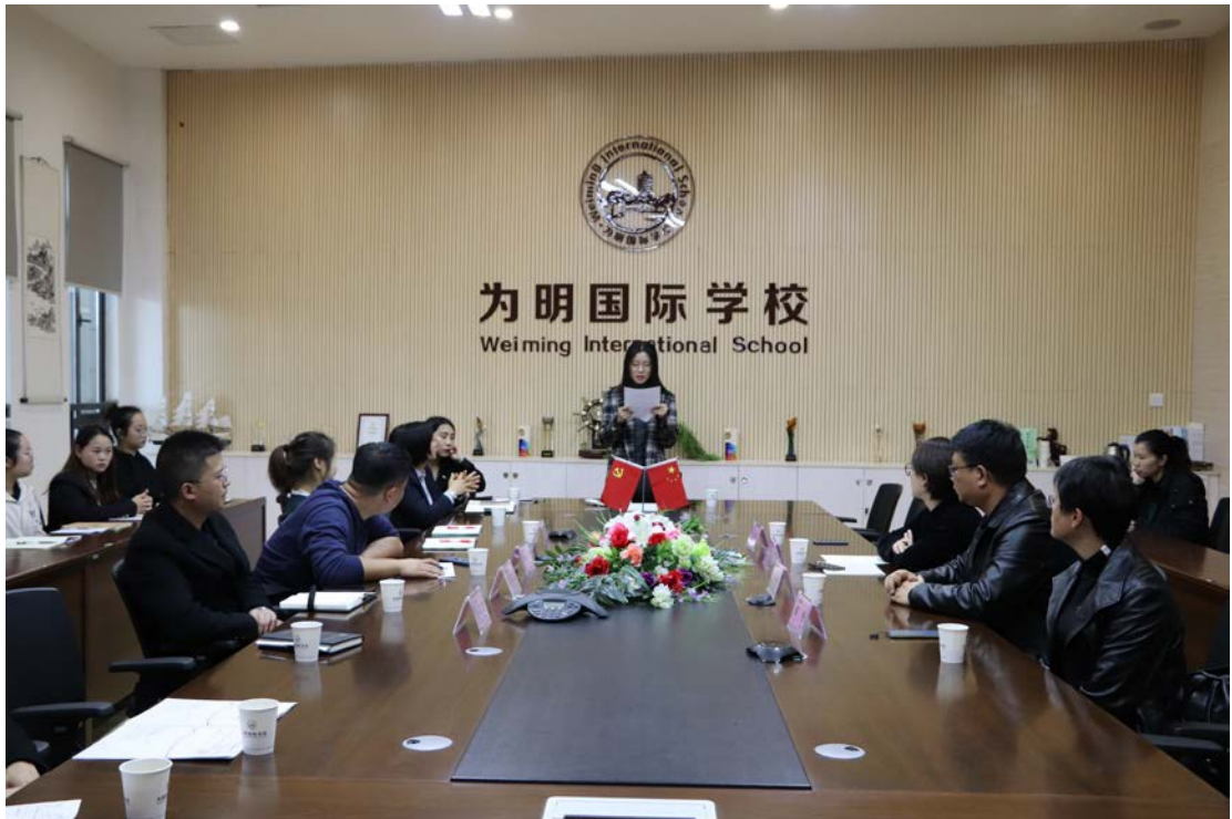
为明国际学校实习生代表发言