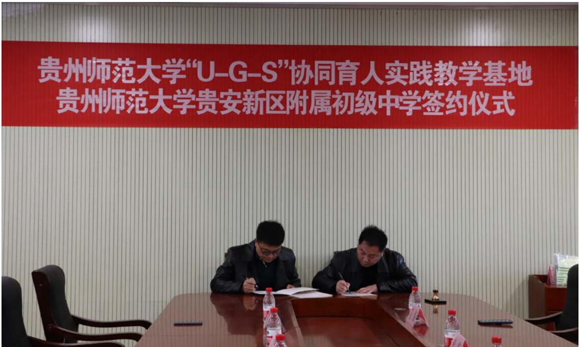
双方签订“U-G-S”协同育人实践教学基地协议