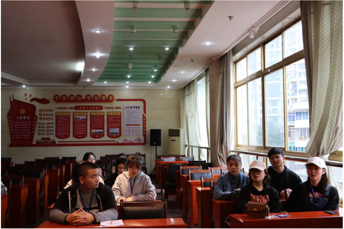
师大附中各专业实习生积极发言