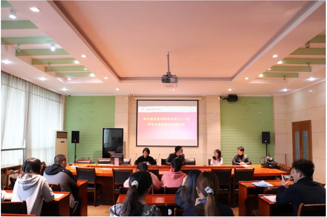
师大附中 学生座谈会