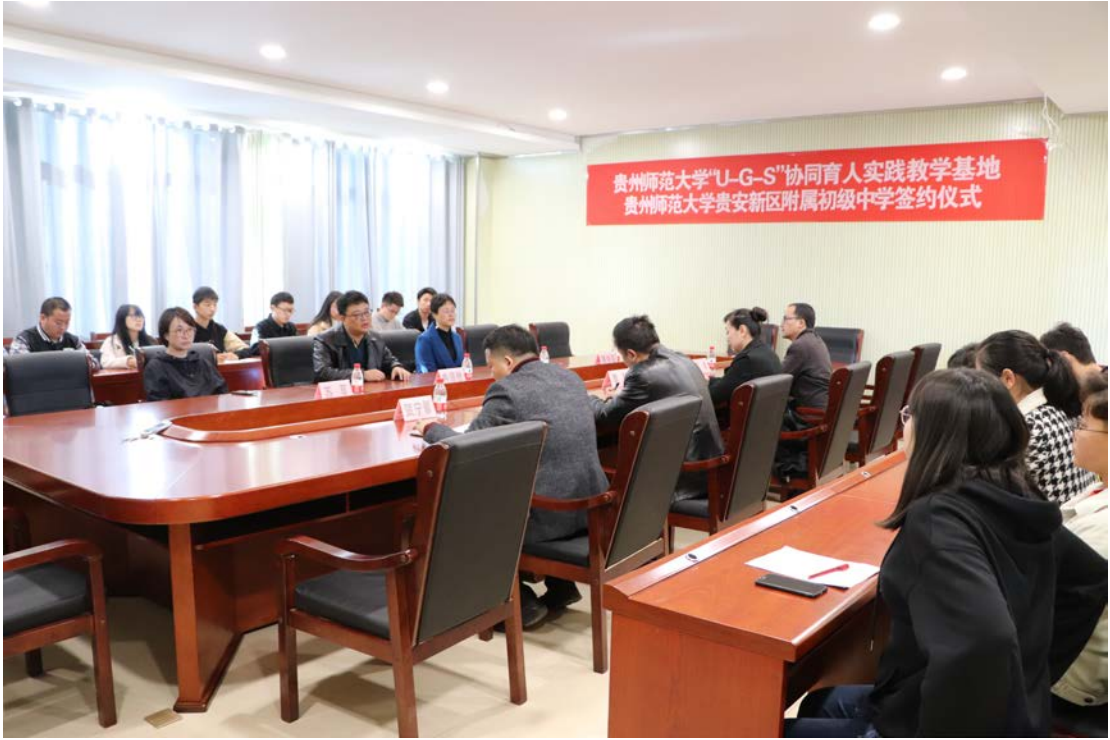
贵安新区附属初级中学教学实习期中检查